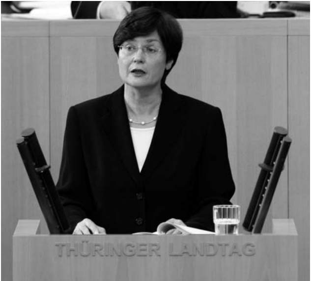
Christine Lieberknecht, Ministerpräsidentin des Freistaates Thüringen