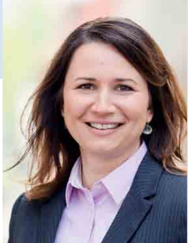
Anja Siegesmund Ministerin für Umwelt, Energie und Naturschutz

Ich lade Sie ein, sich auf den folgenden Seiten zur E-Mobilität und dem geplanten Ausbau der Ladeinfrastruktur in Thüringen zu informieren. Ich hoffe, das Falblatt ist Ihnen eine willkommene Entscheidungshilfe für die Anschaffung eines klimaneutralen Elektrofahrzeugs.